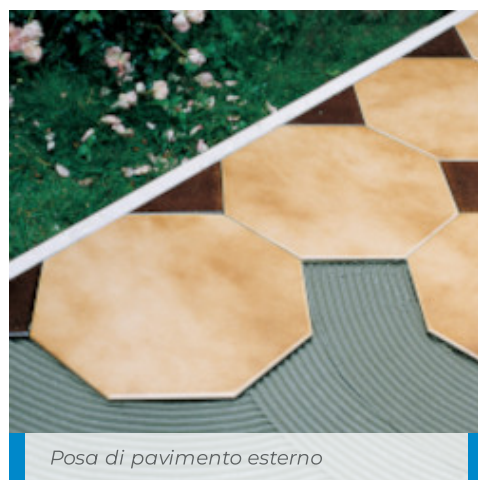
Posa di pavimento esterno