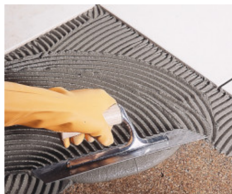
Posa a rivestimento di piastrelle in monocottura su sughero