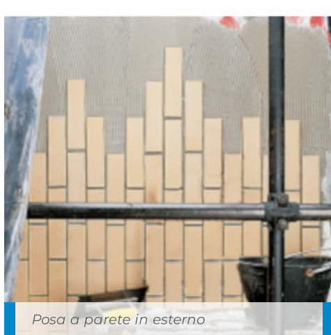
Posa a parete in esterno