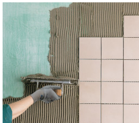
Posa su gesso trattato con Primer G