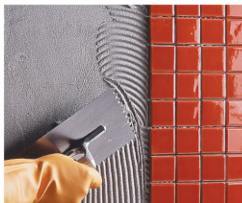
Posa a rivestimento di mosaico ceramico