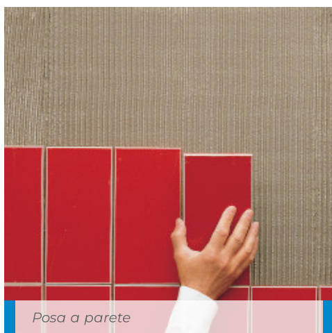
Posa a parete