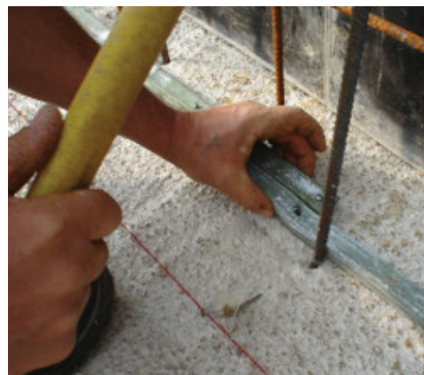
Sormonto dei capi di Idrostop B25