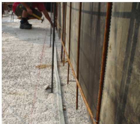
Posa di Idrostop B25

Il nastro di Idrostop B25 può essere applicato su calcestruzzo, metallo, PVC preventivamente pulito. Stendere Idrostop B25 e fissarlo per mezzo di chiodatura ogni 25 cm. Il sormonto tra i capi si otterrà per mezzo di accostamento di circa 6 cm. Lo spessore del getto a protezione di Idrostop B25 non dovrà essere inferiore agli 8 cm. Temperatura di applicazione da -5°C a +50°C.