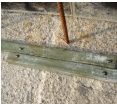
Sormonto dei capi di Idrostop B25