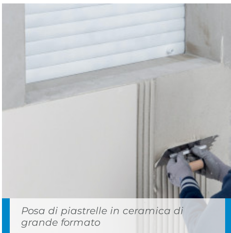
Posa di piastrelle in ceramica di grande formato