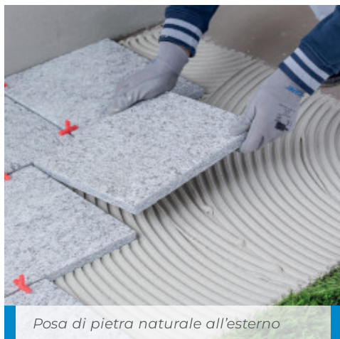
Posa di pietra naturale all'esterno

Nel caso di applicazione di lastre fonoassorbenti o isolanti, applicare Keraflex Maxi S1 a cazzuola o a spatola a punti, nello spessore richiesti dalla planarità delle superfici e dal peso del pannello.