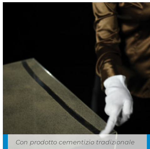
Con prodotto cementizio tradizionale