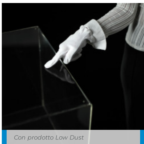
Con prodotto Low Dust