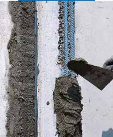
Applicazione con cazzuola