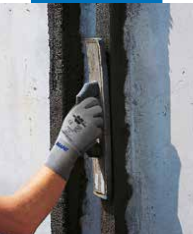
Rifinitura con frattazzino